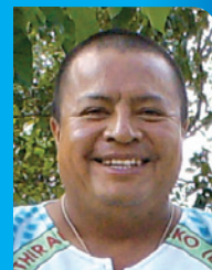
Por: P. Moisés GARCÍA, mccj

¿Buscas tu felicidad, tu vocación, cómo amar y cómo servir? Para contestar estas y otras preguntas es necesario hacerse muchas más, aunque algunas no tendrán contestación o, por lo menos, no a corto plazo. Hoy te invito a encontrarte con una sola interrogante: «¿Vienes con nosotros, o qué onda?».