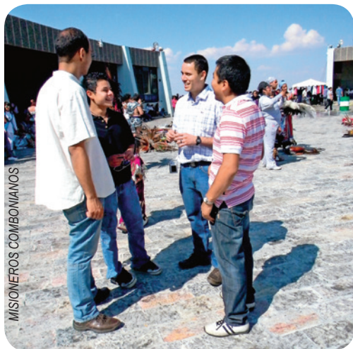
«Algunos jóvenes desean compartir la Buena Nueva de Jesucristo»

par en sus actividades y me decían: «¿Vienes con nosotros, o qué onda?». Me exhortaban a conocer su carisma y servicio a la Iglesia, la cual sigue siendo una poderosa llamada a formar parte de una aventura misionera llena de emociones, de servicio y de amor para los demás, al estilo de Jesucristo.